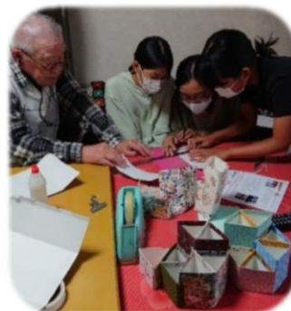
実際に小物入れの作り方を教わりました。