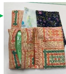
正解者へのプレゼントはティッシュペーパー入れです。