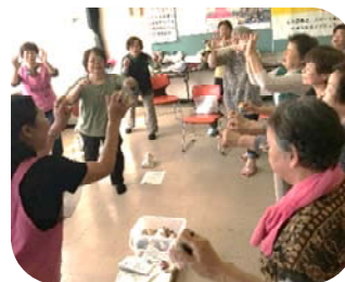
ふれあい・いきいきサロン (地域のサロンでお手玉体操)