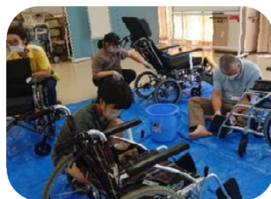
彩の国ボランティア体験プログラム (高齢者施設車いす清掃体験)