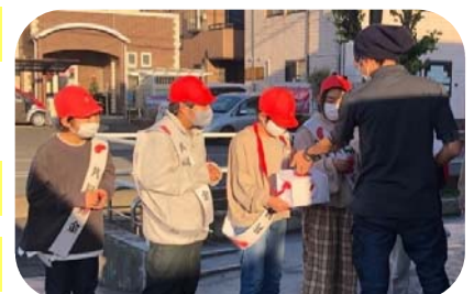
赤い羽根共同募金運動 (委員会活動で子どもたちが実施)

社協だより・つるがしま地域づくり便り「えん」の発行やFacebook・Instagram等を更新することで、社会福祉協議会活動や地域福祉に関する情報を発信します。