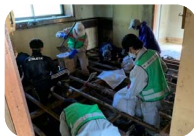
災害ボランティア (被災者に対する支援活動)