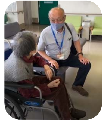
権利擁護支援センター (利用者への定期訪問)