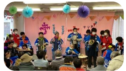
障害者生活介護施設きいちご (地域交流行事きいちごパーティー)