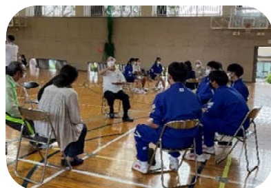
福祉教育・体験学習 (聴覚障がい者の理解と体験)