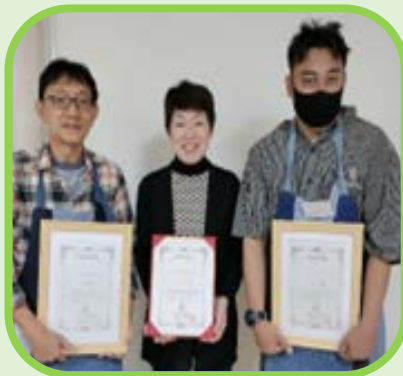
資格を取ったスタッフ2人と社協会長（中央）